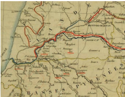
En rouge orangé, le tracé du canal

Cette voie de navigation traversera 110 communes sur 5 départements, possédera 274 écluses de 38 m de longueur. Le canal sera navigable pour des navires de 200 tonnes grâce à sa largeur de 22 m et sa profondeur de 3 m. Il deviendra souterrain au plateau de Lannemezan sur 3 670 m et rejoindra ensuite la vallée de l’Adour pour finir au Bec du Gave. De là, les navires accèderont à l’océan par l’Adour. “On évitera par ce