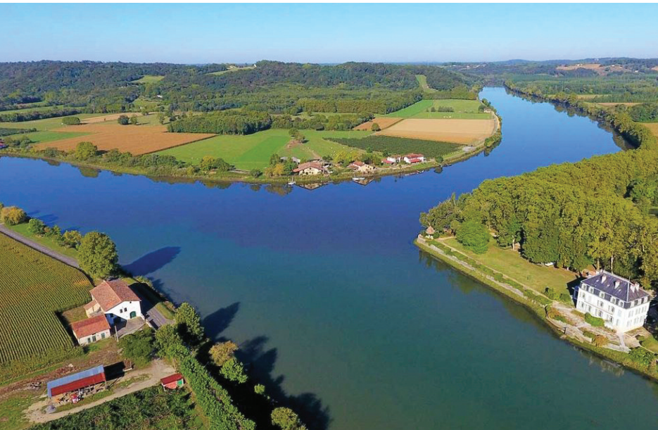
Le canal royal devait déboucher au Bec du Gave pour rejoindre l’océan par l’Adour

En cas de doute, contactez le gardien de déchetterie avant de vous déplacer