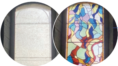
Avant les travaux Après les travaux

C’est le nombre d’habitants recensés à Sames. Il s’agit de la population légale millésimée 2018 qui est entrée en vigueur le 1 er janvier 2021 (source Insee). En raison de la crise sanitaire de la Covid-19, le nouveau recensement de la population qui devait débuter en janvier 2021 est reporté.