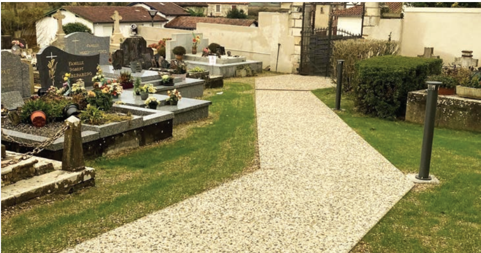
Création d’allées en béton désactivé pour accéder à l’église

Accessibilité, sécurité, embellissement : la rénovation s’est achevée fin 2020