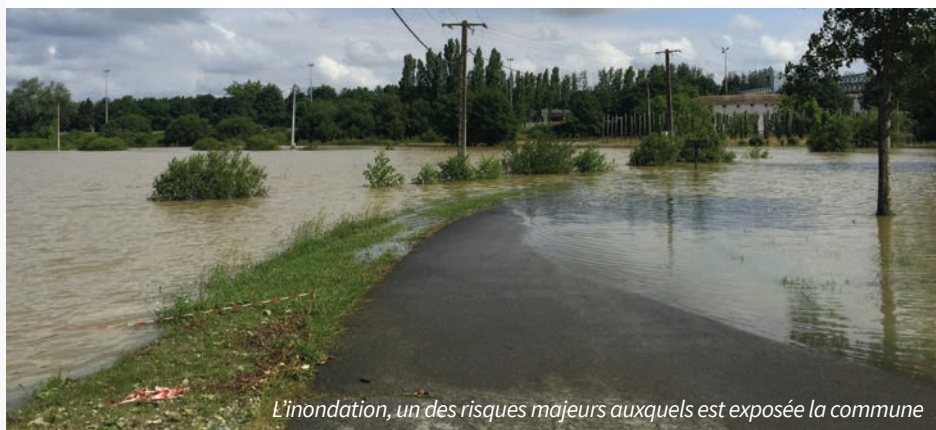
L'inondation, un des risques majeurs auxquels est exposée la commune

Ce plan communal définit l'organisation prévue pour assurer l'alerte, l'information, la protection et le soutien de la population au regard des risques présents sur la commune